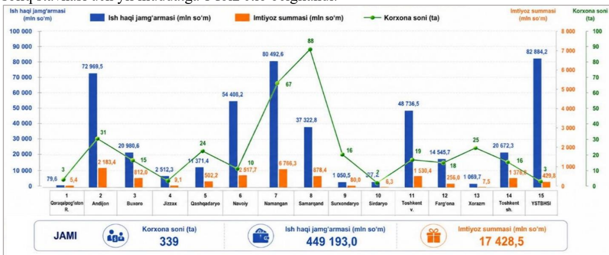
3-rasm. Ijtimoiy reyestrda kiritilgan oilalar a‘zolarini ishga qabul qilgan korxonalar uchun ijtimoiy soliqni 1 foiz qo‘llashga doir imtiyozlar tahlili 52

maqsadida, ishga qabul qilingan ushbu toifadagi xodimlarga to‘lanadigan mehnat haqi xarajatlaridan uch yil davomida 1 foizlik miqdorda ijtimoiy soliq to‘lash imkoniyatini berish taklif qilindi. Natijada, Prezidentning 2024-yil 23-sentyabrdagi Farmoni bilan 2025-yil 1-yanvardan boshlab ijtimoiy reyestrda kiritilgan oilalar a‘zolarini ishga qabul qilgan korxonalar uchun ijtimoiy soliq stavkasi uch yil muddatga 1 foiz etib belgilandi.